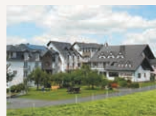
Hôtel ZUM REHBERG www.hotel-rehberg.de