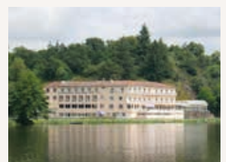
Le Moulin Neuf à Chantonnay www.moulin-neuf.net