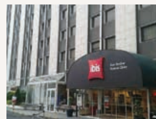
Hôtel Ibis Clichy Batignolles ***