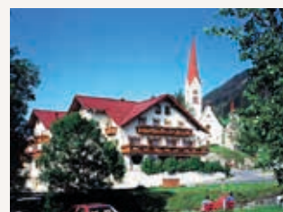
Gasthof Bären www.holzgau.net