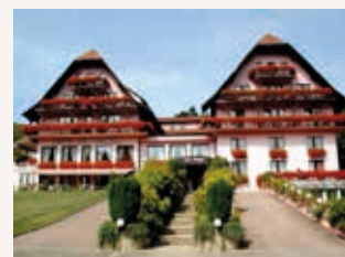
Hôtel des Vosges à Klingenthal www.hoteldesvosges.eu